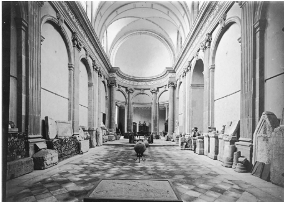
Musée dauphinois en 1908 Chapelle de Sainte-Marie-d'en-Bas